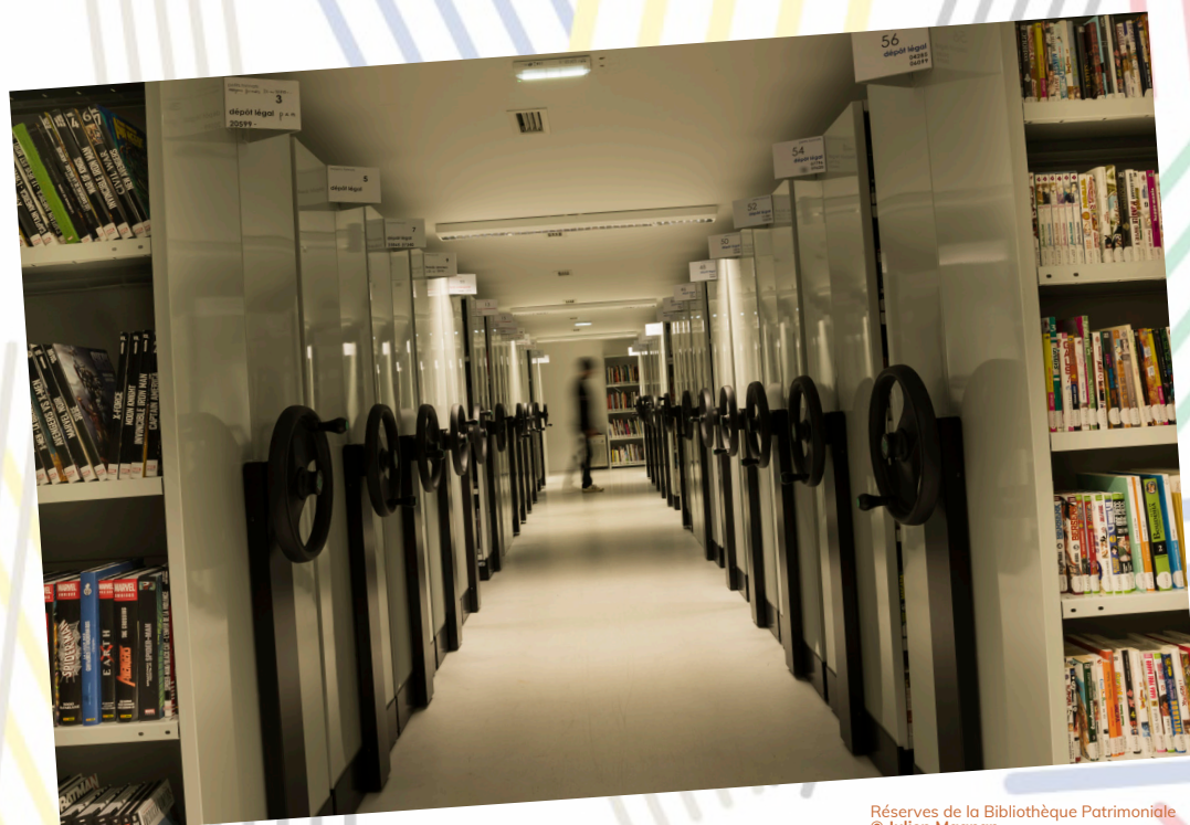
Réserves de la Bibliothèque Patrimoniale