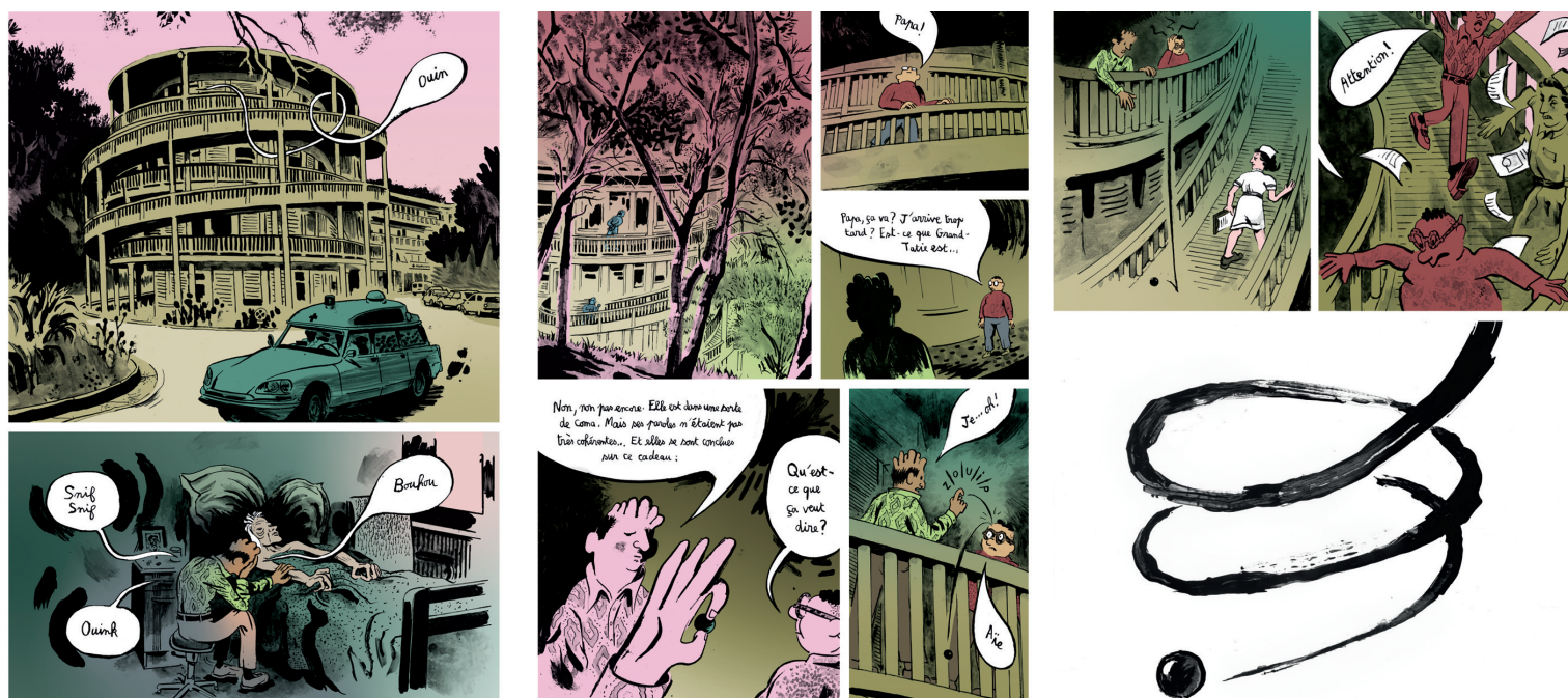
Extrait du Douzième congrès des bonnes vibrations © Renaud Thomas et Thomas Gosselin

En résidence, il travaille sur une bande dessinée d'une centaine de pages intitulée Le douzième congrès des bonnes vibrations, sur un scénario de Thomas Gosselin.