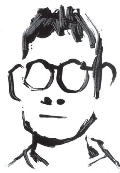
Autoportrait