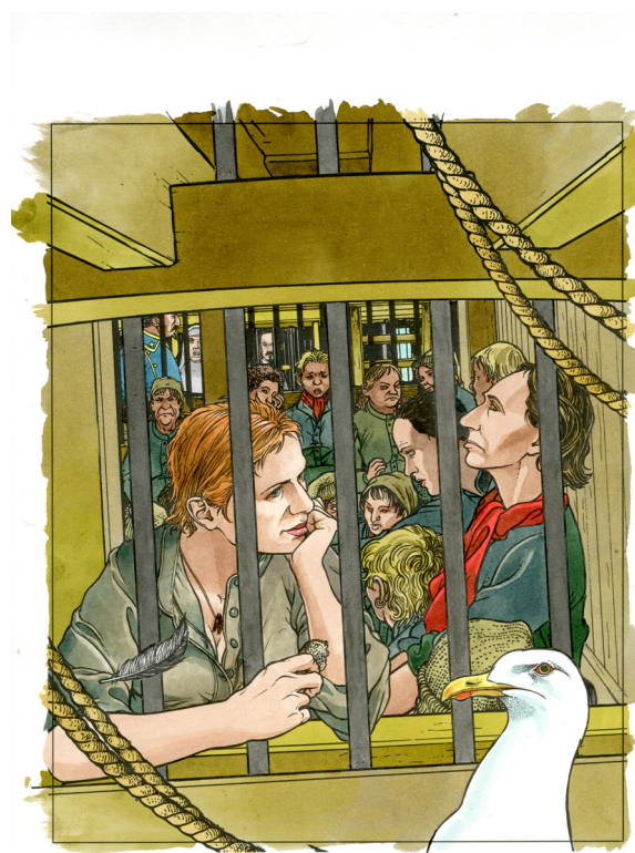
Illustration pour la couverture du Sang des cerises tome 2 © François Bourgeon