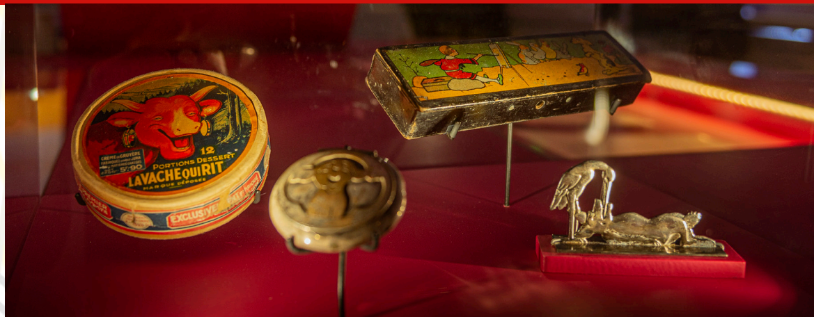
Produits dérivés de l'oeuvre de Benjamin Rabier

Venez découvrir les pièces insolites et inattendues conservées au sein de nos collections : albums, périodiques, objets... à l'image des détournements de Florence Cestac, de la sphère de François Schuiten ou de notre fonds de films fixes.