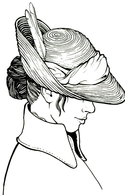
Etude © François Bourgeon