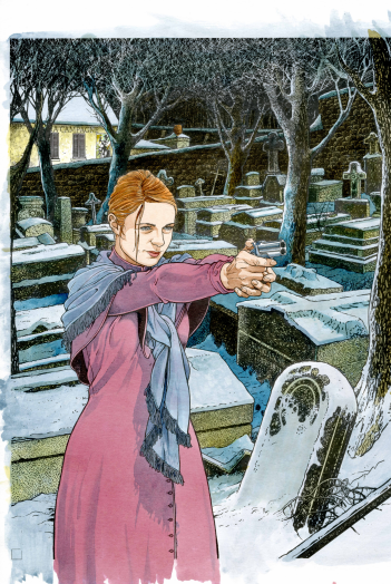
Couverture les passagers du vent , t.8 Le temps de cerises (v. 2017-2018).

Les premiers magazines avec lesquels François Bourgeon collabore, Lisette et Djin , sont des périodiques s'adressant à un lectorat de jeunes filles et même s'il poursuit dans Fripounet et Pif Gadget qui s'adressent à un lectorat mixte, les figures principales des récits de François Bourgeon sont des femmes qui se distinguent par leur curiosité, leur goût de l'aventure et leur besoin de liberté.