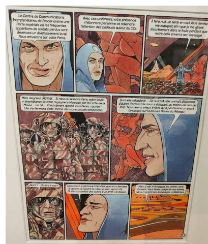
Fig. 7 : BOURGEON, François. Magica . Planches n°1, 2, 3. Publiées dans Djin , n°28, p.37-39, 1976.