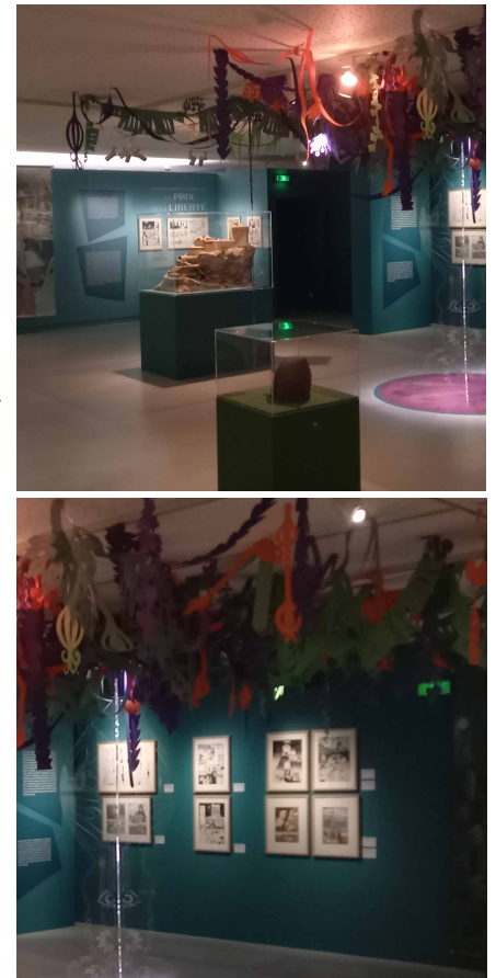
Fig. 1 et 2 : Salle 2

La seconde partie de l'exposition dévoile une sélection particulièrement riche de planches originales extraites des trois œuvres majeures de François Bourgeon : Les Passagers du vent , Les Compagnons du crépuscule et Le Cycle de Cyann . À travers ces volumes, l'artiste explore avec finesse et profondeur les mystères du Moyen Âge et les événements marquants des XVIII e et XIX e siècles, plongeant tour à tour dans les arcanes de ces époques. De manière tout aussi captivante, il s'aventure dans le domaine de la science-fiction, créant un univers où la modernité et l'archaïsme coexistent harmonieusement. Chaque nouvelle traversée d'un univers créé par Bourgeon révèle l'importance qu'il accorde à la vraisemblance de la narration, mise en œuvre par la précision d'un travail de documentation et de réflexion au service d'un récit épique. Par ailleurs, l'artiste utilise souvent le modelage et la maquette comme repère avant de dessiner chaque case de ses planches. Ainsi, il crée un univers cohérent, réaliste et singulier. Si ses sagas ont marqué des générations de lecteurs, c'est bien aussi grâce à cette quête d'authenticité fondée notamment sur une iconographie précise.