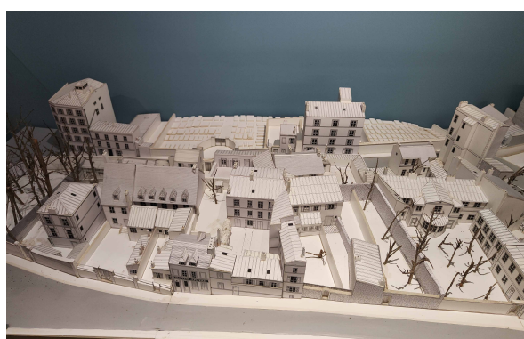
Fig. 2 et 3 : Maquette de Montmartre au XIX e siècle. Visible dans les passagers du vent , tome 8, réalisée à l'échelle 1/100