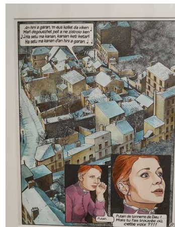
BOURGEON, François. Série Les passagers du vent , t.8 Le sang des cerises , planche 27.

Le travail sur la langue est d'ailleurs une des caractéristiques de l'œuvre de François Bourgeon. Il intègre également à ses dialogues de l'ancien français ou du breton pour accentuer la vraisemblance de son récit. Au lecteur de se livrer au jeu de l'interprétation toujours aidé par l'image. Sans les dessins qui les accompagnent, les dialogues resteraient obscurs, avec les dessins, ils deviennent limpides. Il en va de même pour les Compagnons du crépuscule et pour le Cycle de Cyann .