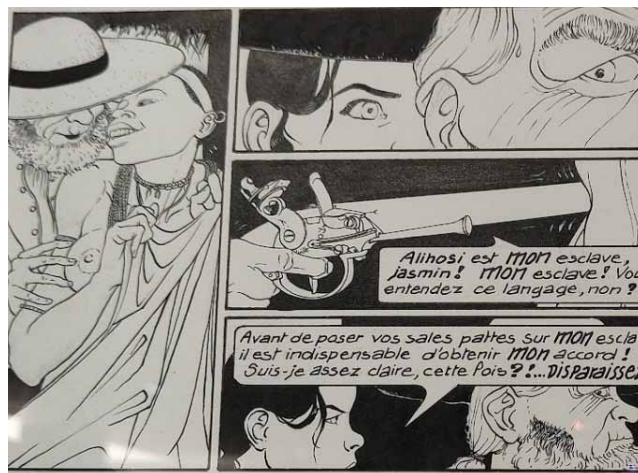
BOURGEON, François. Série Les passagers du vent , t.4 L'heure du serpent , planche 23 (v. 1981-1982).

Cependant, l'héroïne vivra par la suite du commerce d'esclaves faisant d'elle un personnage moralement ambivalent amenant ainsi le lecteur à se questionner sur le passé négrier de la France. Notons que Bourgeon cherche à redonner leur voix aux populations décimées, exploitées et invisibilisées. Ainsi dans les Passagers du vent , il s'attache à proposer des dialogues en créole.