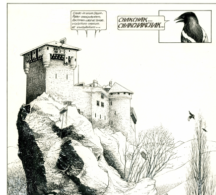
Fig. 5 : BOURGEON, François. Maquette. Travail préparatoire au dessin visible dans la série Les Compagnons du Crépuscule .