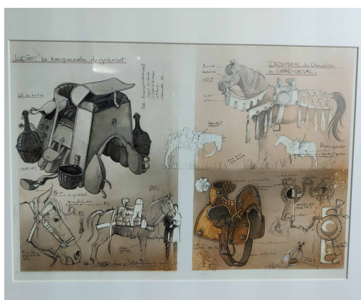
BOURGEON, François. Etudes pour le « Sortilège du bois des brumes », série Les Compagnons du Crépuscule , t.1 (v. 1983-1984).

A côté des œuvres de jeunesse, on peut découvrir les études de l'auteur. On remarque alors qu'il porte une attention particulière à la conception de ses personnages et notamment à leurs costumes. Les vêtements sont en effet un élément de la première importance en ce qui concerne la caractérisation de ses héros, mais aussi des époques et du contexte de ses histoires. Ceci est particulièrement vrai pour Les Passagers du vent et Les Compagnons du Crépuscule : François Bourgeon teste alors matières, formes et couleurs en essayant de s'approcher au maximum de l'authenticité historique.